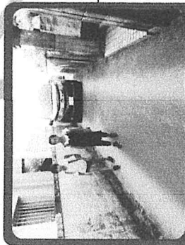
道幅がせまくてキケン 迂回のご協力をお願いします