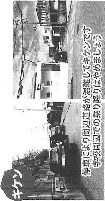
停車により周辺道路が混雑してキケンです 学校周辺での乗り降りはやめましょう