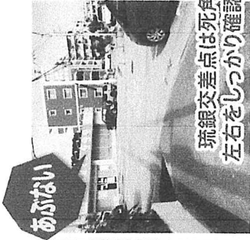
琉銀交差点は死角が多くキケンです 左右をしっかり確認して横断しましょう